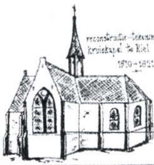
reconstructie-tekening b Kruiskapel te Riel 1510-1621