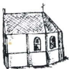
reconstructie-tekening a Kapel van Riel 1444-1519

Riel mocht al betrekkelijk snel een zelfstandige parochie worden. In 1519 deed een aantal inwoners het verzoek aan de bisschop van Luik om zelfstandige parochie te mogen worden. Zij konden dan beter voldoen aan hun kerkelijke plichten zoals de zondagsmis en de paascommunie en men was beducht voor het gevaar van kinderdood vóór het H. Doopsel! De toestemming kwam (officieel pas in 1520). Was de patrones van de kapel nog de H. Catharina, nu werd dat St. Antonius Abt. Het kleine kapelletje diende groter te worden en werd uitgebreid tot kruiskerkje. Wij maakten in 1982 al eens een reconstructietekening van het oude kerkje van Riel. Beter dan door die schetsen kan de uitbreiding niet worden uitgelegd.