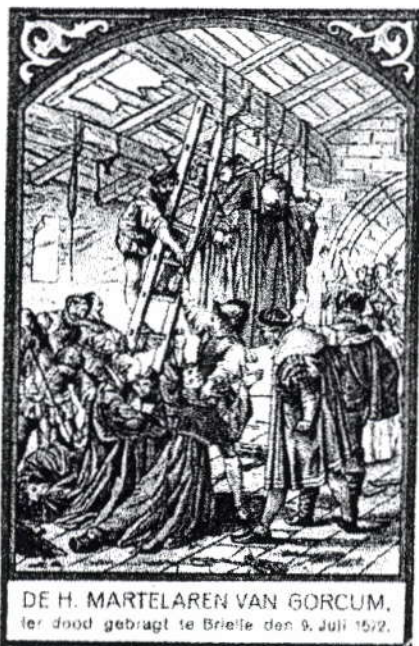
DE H. MARTELAREN VAN GORCUM, ter dood gebracht te Brielle den 9. Juli 1572.

Dit jaar is het driehonderd vijftig jaar geleden dat de Vrede van Munster werd gesloten tussen de Republiek der Verenigde Nederlanden en de koning van Spanje. Die vrede maakte een officieel einde aan de Tachtigjarige Oorlog die grotendeels het karakter had van een godsdienstoorlog. De opstandelingen, de Geuzen, keerden zich vooral tegen de katholieke geestelijken die zij beschouwden als trouwe onderdanen van de Spaanse koning Philips II. Op hun strooptochten overvielen de Geuzen pastorieën en kloosters en namen de daar aanwezige priesters en monniken gevangen. Zo werden in "de blauwe toren" van het kasteel in Gorkum meer dan twintig geestelijken gevangen gehouden, soms ernstig mishandeld. Graaf Lumey, de bevelhebber van de Geuzen,