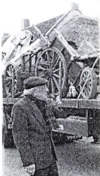
Aankomst karren van transportbedrijf H. van Casteren