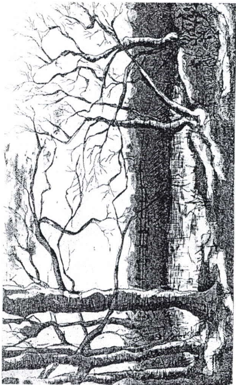
Brandkuil in "I Mortelje". Ets van M. van Oirschot Geschonken door Mevrouw van de Ven - van Oirschot