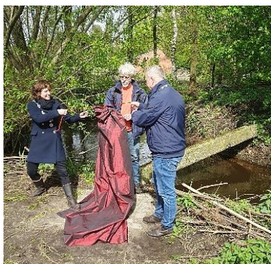
Na de toespraken van de twee burgemeesters wordt de nieuwe grenspaal onthuld en ingewijd.