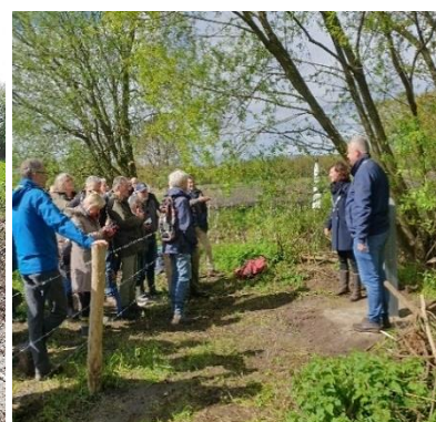
De ceremonie wordt afgesloten en de deelnemers worden uitgenodigd voor een hartverwarmende afsluiting in Klooster Nieuwkerk.