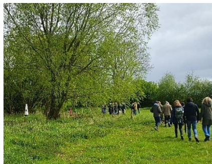
De groep nadert de plaats met links een grenspaal (België-Nederland) en rechts van de Wilgenboom de ingepakte nieuwe grenspaal (Goirle-Alphen).