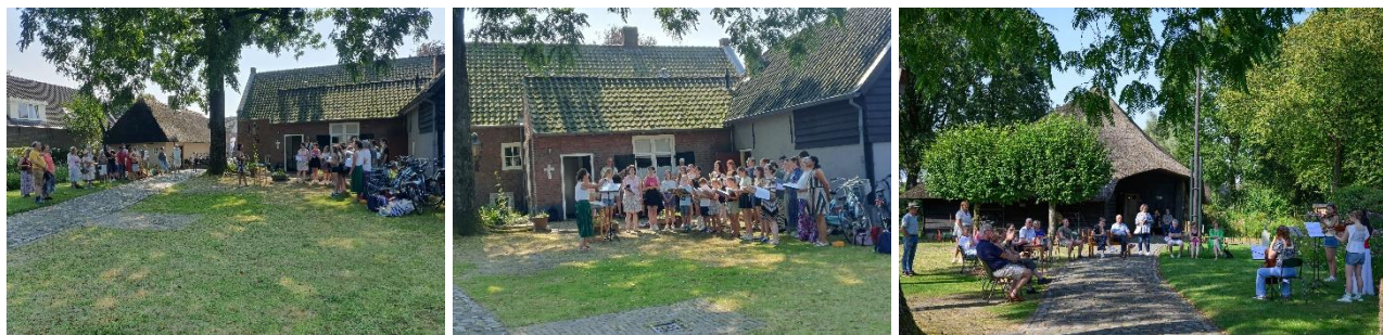
Optredens van jongerenkoor GoTiKo, kinderkoor Eigenwijs, en strijkersensemble Zagerij Klassiek

voorbereidingstijd waren de uitgevoerde stukken een streling voor het oor en vormden op deze manier een mooie afsluiting van een sfeervolle middag.