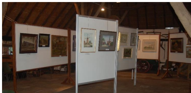
Opstelling 'schone plekskes' in heemshuur

Het is een geslaagde tentoonstelling geworden, er was een goede, levendige sfeer, veel bezoekers reageerden positief en uitten hun waardering voor het gebodene. Naar schatting hebben ruim 500 mensen de tentoonstelling bezocht.