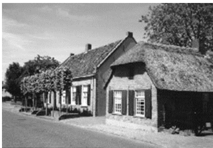
Figuur 1 Het aanzien van Heemerf De Schutsboom langs de Nieuwe Rielseweg

Het heemerf kreeg door de inspanning van eigen heemleden, in samenwerking met de gemeente, verder gestalte door inrichting van de twee panden als museum, restauratie van het Smiske en inrichting als wevershuisje, bouw van het Pleehuis, bouw van een karloods, aanleg van een heemtuin met een bijenstal, aanleg van alle technische installaties en het aanbrengen van plaveisel op het erf.