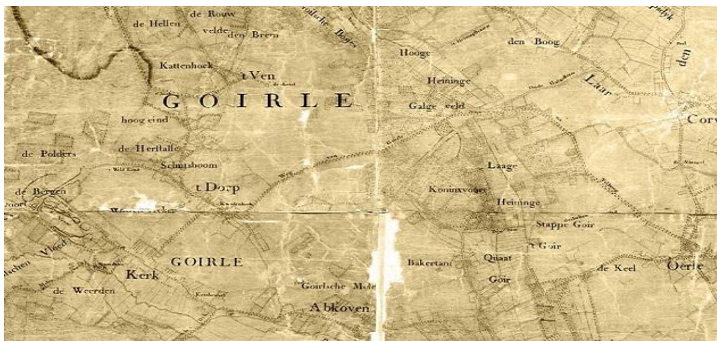
Kaart van Zijnen, Goirle

Stichting Erfgoed Goirle "De Vyer Heertganghen"