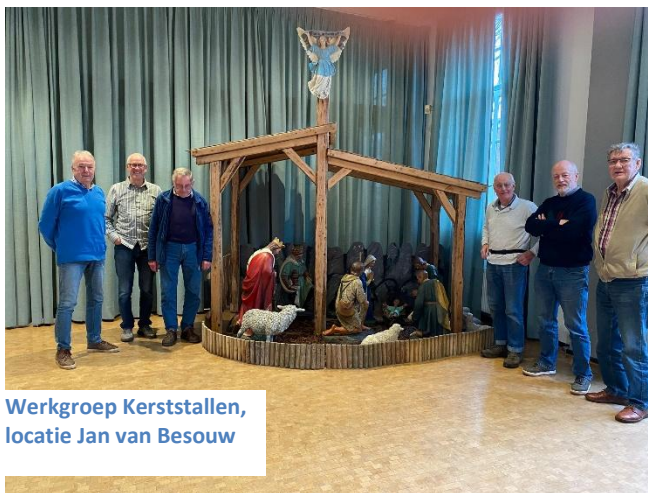
Werkgroep Kerststallen, locatie Jan van Besouw

Een kerststallenroute waarbij je door middel van een wandel, fiets, auto-tocht door Goirle en Riel ging en daar tegelijkertijd op sommige plekken optredens van verschillende soorten en maten tegen kon komen. Het doel van de initiatiefnemers was dan ook om een gezellige buitenactiviteit aan te bieden tijdens de donkere feestdagen. De route was voor iedereen vrij te bewandelen en in de weekenden klonk er op diverse locaties en verschillende tijden zelfs live- muziek en waren er diverse optredens.